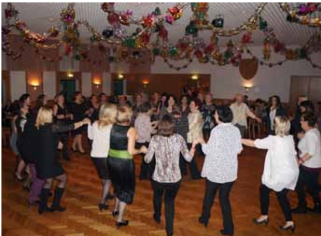
Ausgelassene Stimmung der Damen beim 2. Moosbrunner Weiberball der Volkspartei Moosbrunn