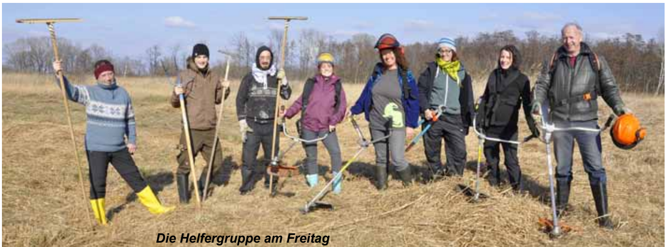
Die Helfergruppe am Freitag

schaftlichen Versuch der Bioforschung Austria dient. Es geht dabei um die Erforschung des Humusaufbaus in Ackerböden. Neben zahlreichen freiwilligen Helfern vom Naturschutzbund NÖ und aus der Gemeinde Moosbrunn waren auch zehn Jugendliche vom Service Civil International (SCI) mit dabei, die einmal mehr ihre Freizeit in den Dienst von wertvollen Naturgütern stellten. Die Jugendlichen aus Österreich, Frankreich und Italien wurden in der Gemeinde herzlich empfangen und übernachteten im Turnsaal der Volksschule. Großen Einsatz zeigte auch eine Gruppe von Absolventen der Abteilung für Vegetationsökologie und Naturschutzforschung der Universität Wien, die heuer ebenfalls die Pflege des Naturdenkmals tatkräftig unterstützte und so mithalf, die Lebensbedingungen für seltene Arten wie Mehl-Primel und Alpen-Fettkraut zu verbessern.