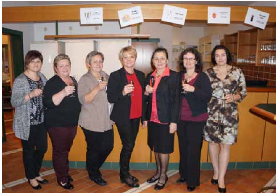
Im Bild die zufriedenen Organisatorinnen des Weiberballs

und Poldi Steyrer , eine Schwarz-Weiß-Tanzvorführung als Mitternachtseinlage dargeboten, die mit tosendem Applaus bejubelt wurde. Im Anschluss wurden dann die vielen und sehr schönen Tombolapreise verlost. Mit Tanz und guter Unterhaltung wurde bis in die frühen Morgenstunden weitergefeiert. Eine Fortsetzung des Balles wird es sicherlich auch im nächsten Jahr geben.