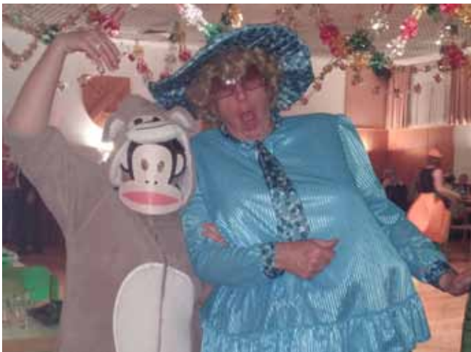
Beim Sportlermaskenball im Festsaal war die Stimmung wieder mal grandios