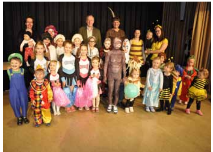
Beim Kindermaskenball der Volkspartei Moosbrunn wurden die besten Masken prämiert