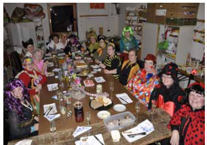
Auch die Bastelrunde feierte im Bastelraum ausgelassen den Faschingsmontag