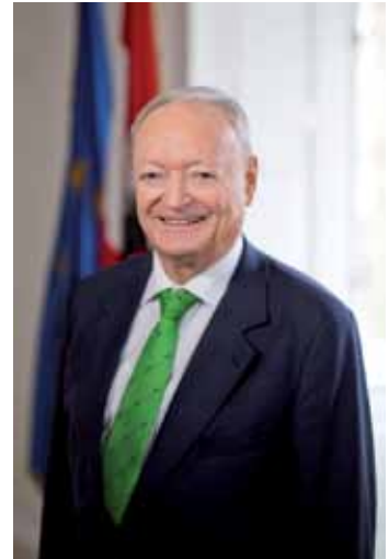
Dr. Andreas Khol

Dass Österreich ein blühendes Land in einem blühenden Europa ist. Mit hoher Lebensqualität, einer gesunden Umwelt, einem starken Zusammenhalt nach Innen und einer erfolgreichen Zusammenarbeit nach Außen.