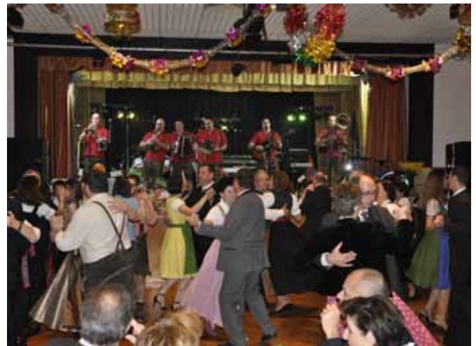
Tanzfreudiges Publikum beim traditionell in Moosbrunn stattfindenden Ball der Landjugend Schwechat