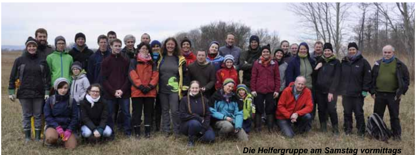
Die Helfergruppe am Samstag vormittags