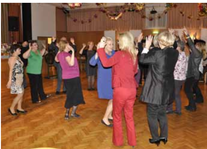
Bei der Schlagerparade der SPÖ Moosbrunn wurde ebenfalls fleißig das Tanzbein geschwungen.