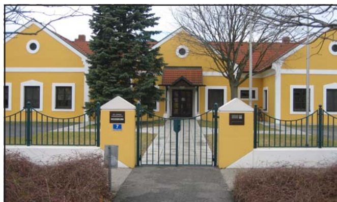
Auch für 2½-jährige Kinder soll der Kindergarten Platz bieten

glich sein, allen Eltern die bestmögliche Betreuung ihrer Kinder zu garantieren. Nach den erfolgreich verlaufenen Gesprächen soll, nach positivem Gemeinderatsbeschluss, mit der Planung eines Zubaus ehestens begonnen werden, sodass womöglich noch im Sommer mit dem Bau gestartet werden kann. Auf eine ökologische Ausrichtung des Hauses wird großer Wert gelegt. Die dritte Gruppe sollte dann bereits im Frühjahr 2009 zur Verfügung stehen.