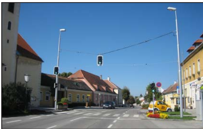
Warnhinweise an Hauptstraßen - insbesondere die für Schüler und ältere Mitbürger errichtete Ampel - geben mehr Sicherheit

Sicherheit unserer Schulkinder sowie älterer Mitbürger, die durch das Gemeindegassl zum BILLA-Markt einkaufen gehen, optimal gesorgt. Ebenso sind die Blinklichteinrichtungen auf der Wienerstraße (vor Volksschule), der Unterwaltersdorferstraße (beim Sportplatz) und Trumauerstraße (bei Arztordination) beispielgebend.