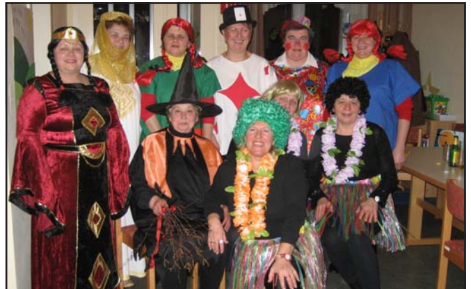
Sind sie nicht fesch, die reiferen Girls beim Frauen Fasching?