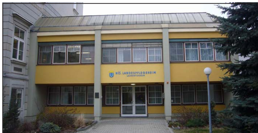
Viele Moosbrunner/innen verbringen hier einen gut betreuten Lebensabend

Im eigenen Haus können Pflegedienste wie Hauskrankenpflege, Heimhilfe, „Essen auf Rädern“, Botendienste, usw. eingerichtet werden. Weiters steht das NÖ Landespflegeheim Himberg zur Verfügung - viele Moosbrunner/innen verbringen hier in vertrauter Umgebung einen gut betreuten Lebensabend. Zusätzlich möchte die Gemeinde künftig