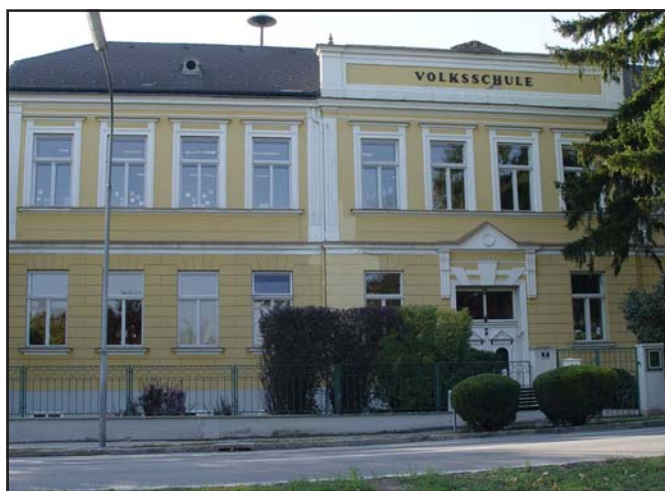
Zum 100-Jahre-Jubiläum wird die Volksschule herausgeputzt

Bekanntlich wird im heurigen Jahr die Moosbrunner Volksschule 100 Jahre alt. Aus diesem Anlass wird das im Jahr 1908 als so genannte „Kaiser Franz Joseph-Jubiläums-Volksschule“ erbaute, in den letzten Jahren mehrfach renovierte und ausgebaute Schulhaus heuer einer weiteren Modernisierung unterzogen. Seit etwa einem Jahr ist der vom Bürgermeister eingesetzte Baubeirat mit der Vorbereitung der Renovierungsarbeiten befasst. Auf Basis der Ergebnisse eines Ausschreibungsverfahrens wurde zuletzt durch genanntes Gremium in der Sitzung vom 20. Februar ein Vergabevorschlag für die Gemeindevertretung erarbeitet, diese wird in ihrer Sitzung am 5. März 2008 die Professionistenleistungen vergeben. Also zeitgerecht, damit die Arbeiten über den Sommer bis Schulbeginn wieder abgeschlossen sind.