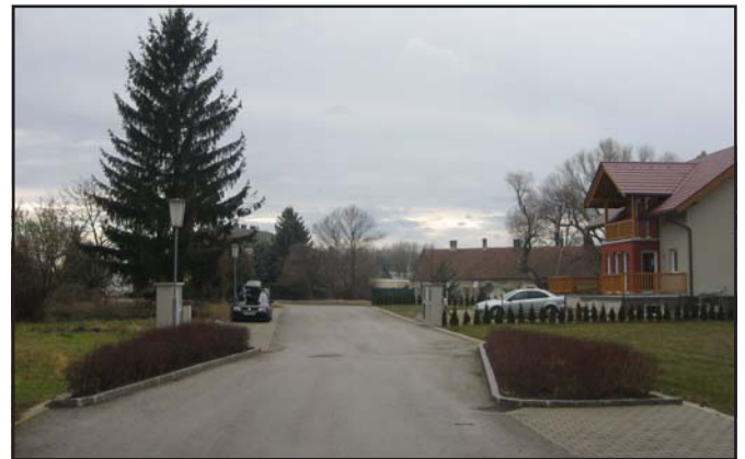
Gut ausgebaute Parkplätze auf verkehrsberuhigten Straßen