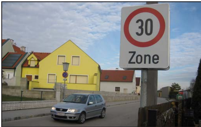
Tempo 30 bringt spürbare Verbesserungen in Wohngebieten

Für jedes Haus soll zumindest ein Besucherparkplatz auf öffentlichen Straßen bereitstehen. Daher soll die Baubehörde bei Bewilligungsverfahren den zunehmenden „Wildwuchs“ breiter Hauseinfahrten bzw. Vorplätzen auf Eigengrund, Car-Ports, u.ä. eindämmen. Parkplatzgestaltungen sollen auch der Verkehrsberuhigung dienen.