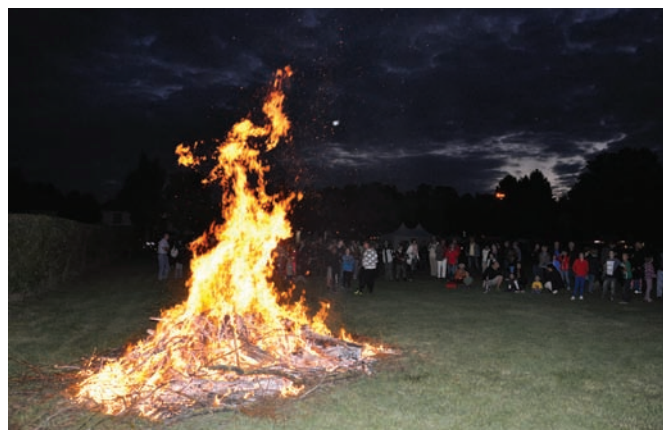
Das stimmungsvolle Sonnwendfeuer