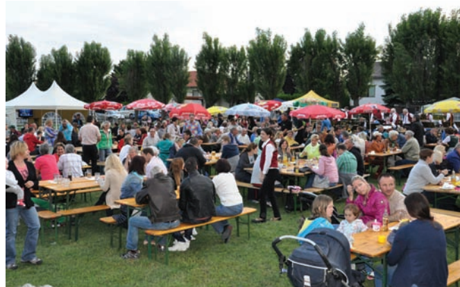
Bei gutem Wetter war die Schillingerwiese sehr gut besucht und die Stimmung war toll.