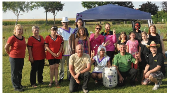
Die fleißigen Helfer nach dem erfolgreichen Fest